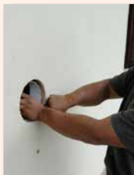
inserimento scambiatore calore