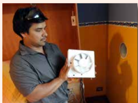
posizionamento gruppo motore